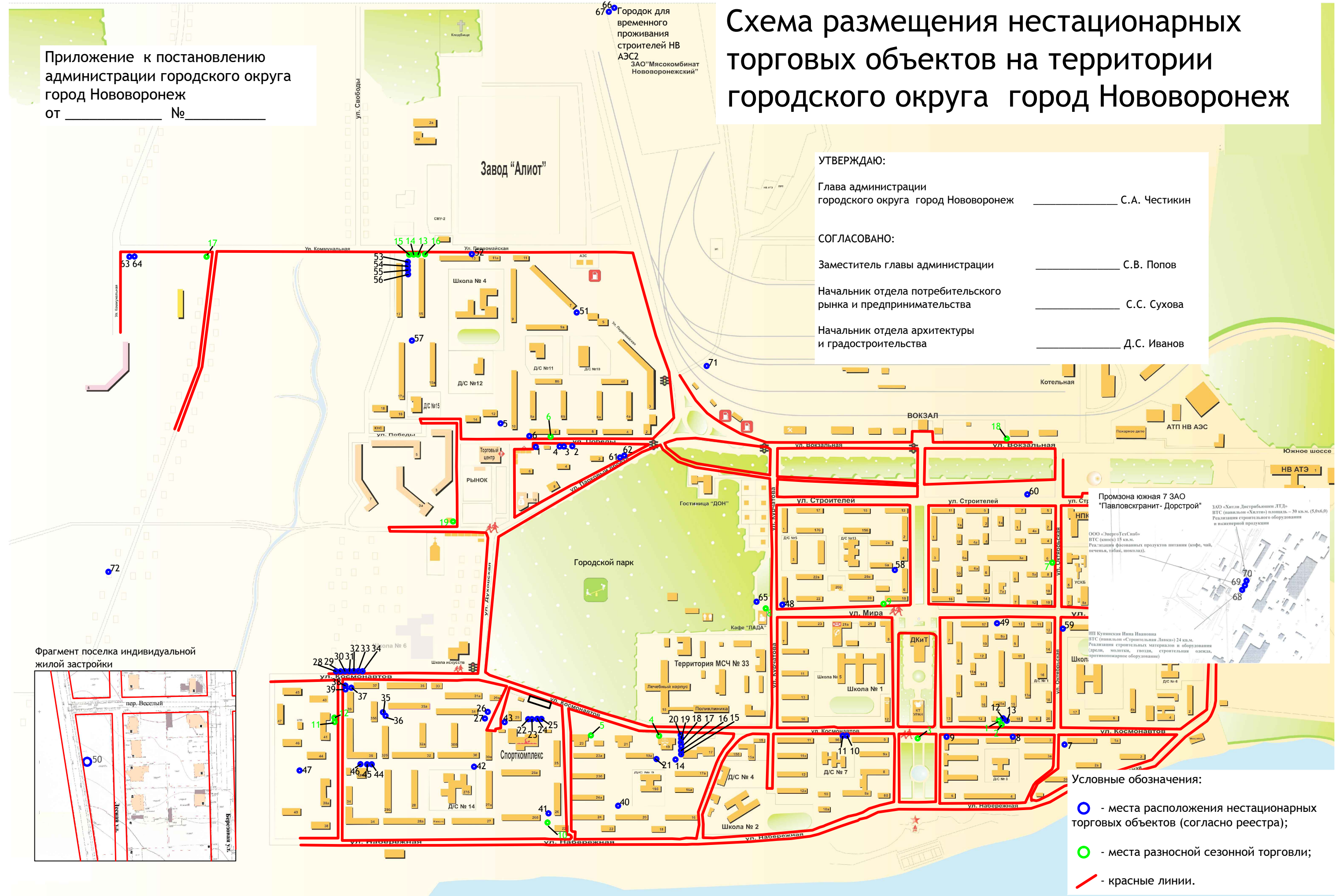
Схема размещения нестационарных торговых объектов на территории городского округа город Нововоронеж

66 Городок для временного проживания строителей НВ АЭС2 ЗАО "Мясокомбинат Нововоронежский"